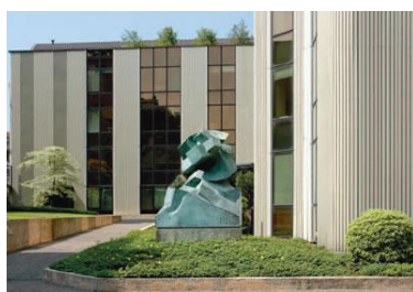
Sede di Federchimica - Opera di Giò Pomodoro "Sole Romulo", 1987